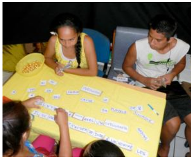
Quelques phrases des plus grands philosophes à reconstituer.