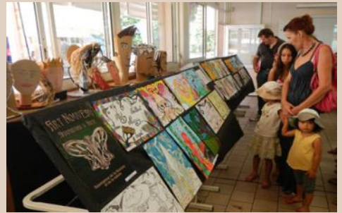
Une exposition riche et variée...

Ils ont exposé leurs œuvres qui, rappelons-le, s'appuient sur le thème choisi en début d'année, à savoir l'écocitoyenneté, l'environnement et le recyclage. Des productions qui ont été fort appréciées des visiteurs qui ont pu découvrir : de la passion, de la technique et même de la virtuosité mais aussi, beaucoup d'imagination !