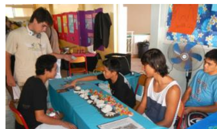
La couleur des fleurs...