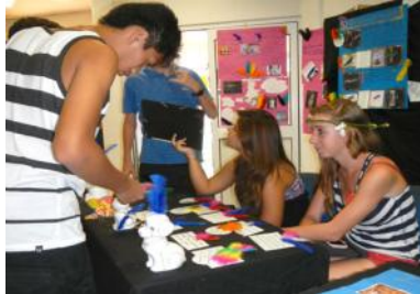
Un jeu sur le romantisme !

Le Festival des Talents ne pourrait exister sans sa partie littéraire. Le département en charge avait choisi un des thèmes du programme étudié en cours, à savoir : les différents mouvements littéraires. Du XVII e siècle à nos jours, l'étude de ces différents mouvements a donné lieu à des recherches, des exposés... que le festival s'est approprié. Grâce à de nombreux affichages apportant de multiples informations, il était alors possible de répondre correctement aux questionnaires qui étaient proposés au public, en référence à ces différents thèmes. De plus, les 1 re STD2A (design et arts appliqués) ont réalisé une exposition sur le thème de l'utopie (représenter un monde idéal !), les plus belles œuvres ayant été primées.