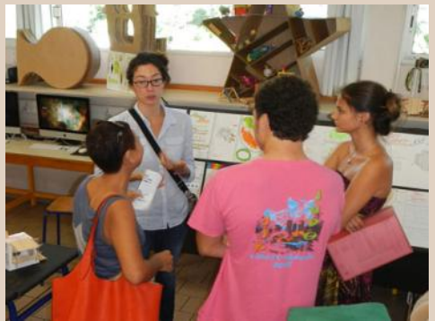
... et beaucoup de demandes de renseignements sur la filière.