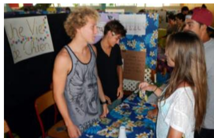
Les sens aiguisés des chiens...