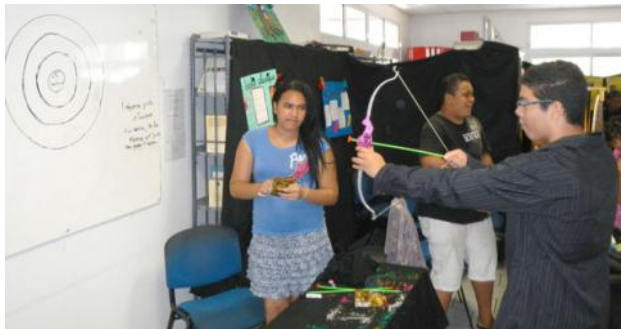
Le classicisme (XVII e ) . La difficulté de la question dépendait de la qualité du tir à l'arc dans la cible !