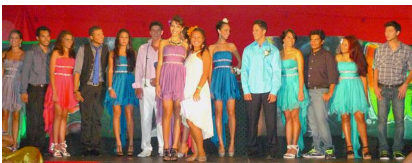
L'ensemble des candidats réunis sur l'estrade avant le verdict final.