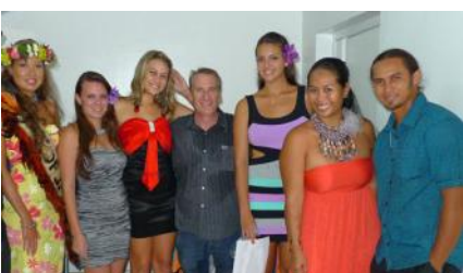
Le jury de la soirée...