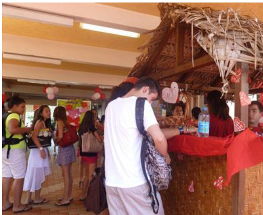
Le kiosque de vente situé dans le hall d'entrée du lycée a été pris d'assaut.

Fête commerciale ou occasion de montrer sa flamme, là n'est pas le problème. Depuis plusieurs années déjà les élèves de CAP première année d'Employé de commerce multi-spécialités (ECMS) se sont emparés de cet événement pour parfaire leurs techniques de vente. Que ce soit à Raapoto