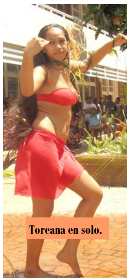
Toreana en solo.