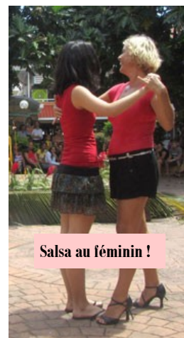
Salsa au féminin !